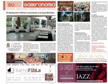
Publlirreportaje Restaurante Palmira