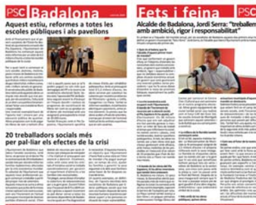
Boletín bimestral Partido Socialista.

Federaciones, asociaciones, gremios y empresas pueden usar este servicio para dar a conocer periódicamente a sus clientes y asociados la actualidad, novedades, y servicios que ofrecen. Ejemplos: