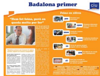
Boletín trimestral Partido "Convergència i Unió".